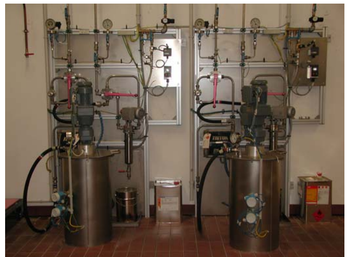
Farbversorgung für Lacke

Die Geschichte von Reiter begann mit der Entwicklung und Fertigung einzelner Komponenten für die Lackiertechnik. Reiter – nun schon seit 35 Jahren in der Lackiertechnik zu Hause – ist ein Unternehmen, das auf seine Erfahrung setzt und sich gezielt auf das konzentriert, wovon es am meisten versteht.