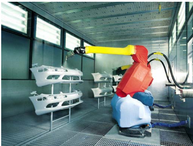
Kunststoff-Applikation mit Roboters