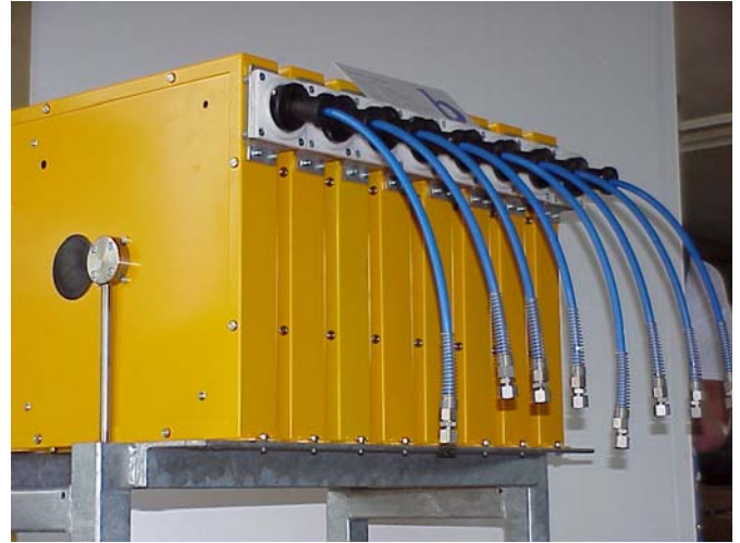
Schlauchaufroller BAROLL für manuelle Lackieranlage