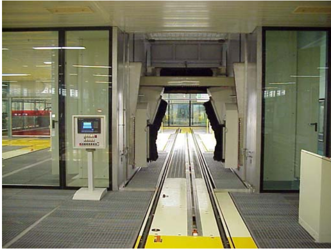
EMU – Karosserie-Reinigungsanlage zur Reinigung der Karosserie vor dem Lackierprozess

BESSERE LÖSUNGEN SIND DIE SUMME ÜBERZEUGENDER DETAILS.