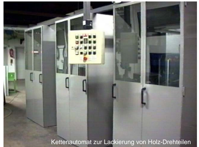
Kettenautomat zur Lackierung von Holz-Drehteilen