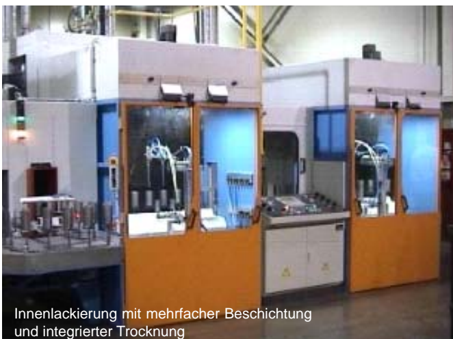
Innenlackierung mit mehrfacher Beschichtung und integrierter Trocknung