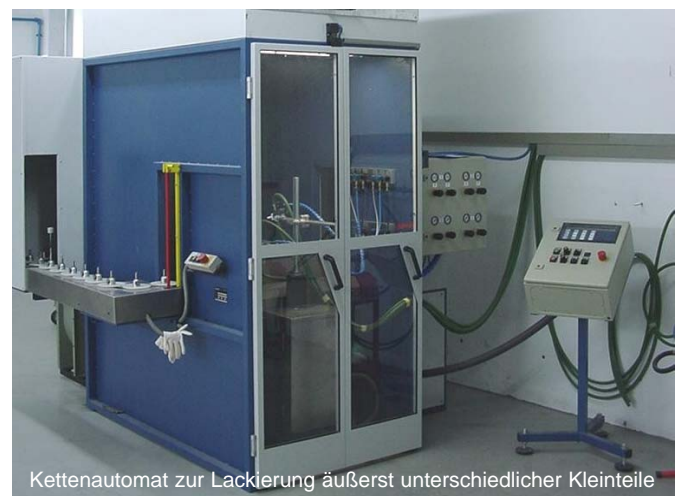
Kettenautomat zur Lackierung äußerst unterschiedlicher Kleinteile