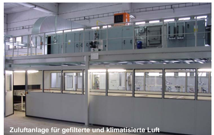
Zuluftanlage für gefilterte und klimatisierte Luft