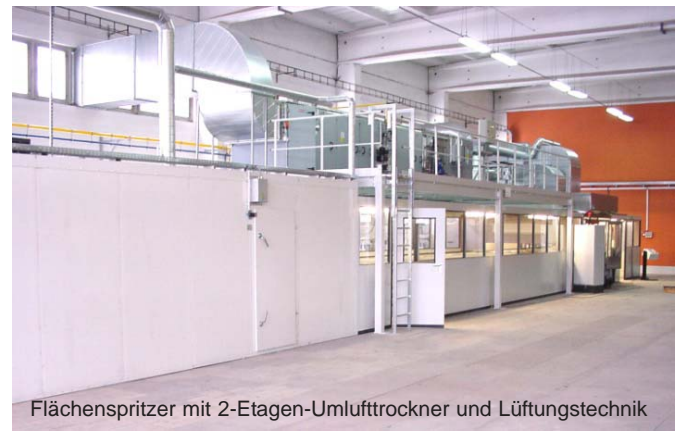
Flächenspritzer mit 2-Etagen-Umlufttrockner und Lüftungstechnik