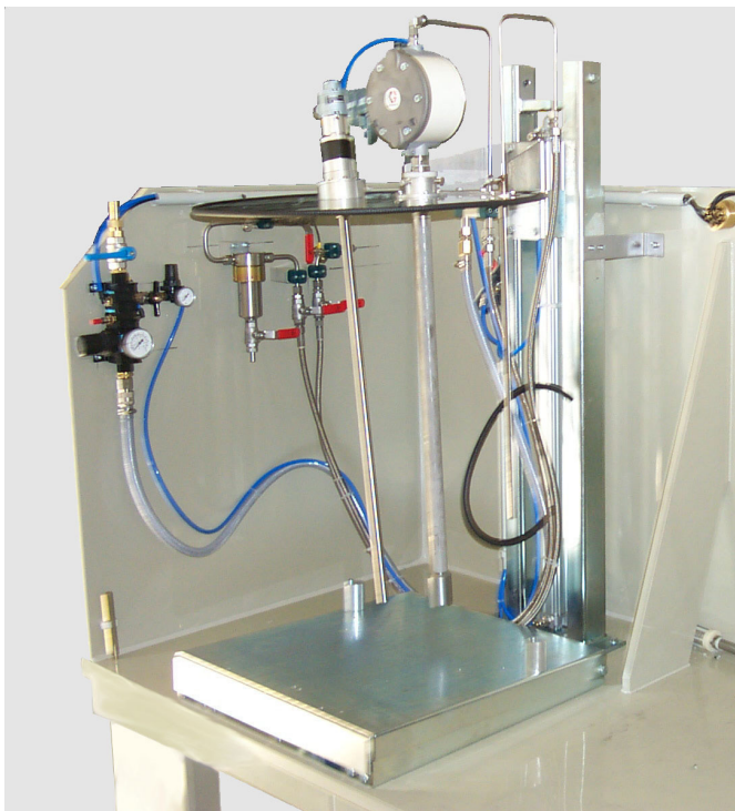
Hebeeinheit mit Minimum-Überwachung auf Isolierschemel

Die Hebeeinheit ist eine stabile Schweißkonstruktion für Wand- und Bodenbefestigung mit Aufnahmen für Behälterdeckel. Der pneumatisch betriebene Teleskop-Hubmast, wird durch ein federmittelzentriertes 5/3-Wege-Handhebelventil gesteuert.