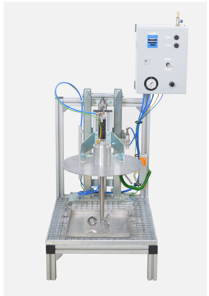
Aufrührstation für 30l-Hobbock mit Timersteuerung für die Einstellung der Rührzeit (optional)