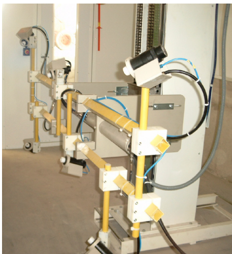
Hubgerät mit isoliertem Sprühsystemaufbau und reproduzierbarer Sprühsystem-Halterung.